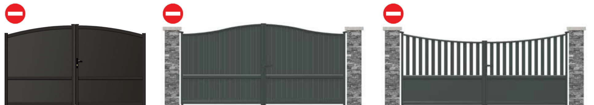
portail 2 battants cintrés, arrondis dits «chapeau de gendarme», incurvés, etc... interdits