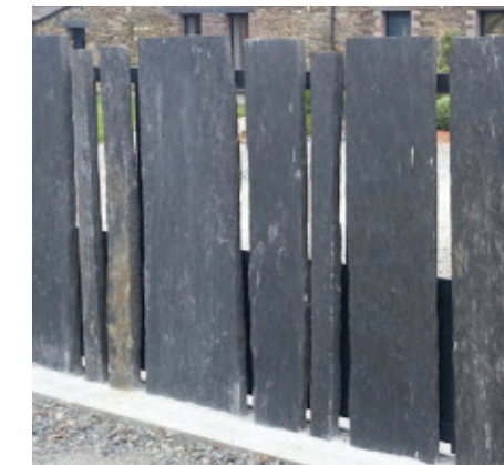
palis & barrettes de schiste