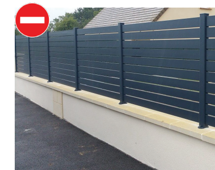
muret de soubassement surmonté d'une clôture interdite