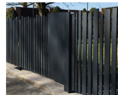
clôtures métalliques à lames verticales > lames irrégulières en largeur et hauteur / lames fines aux profils inclinés