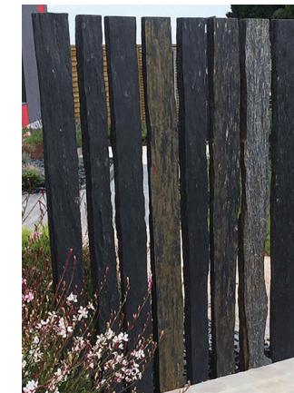
piquets/barrettes de schiste