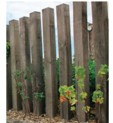
bastaings en bois naturel