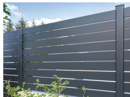
clôture à claire-voie en aluminium