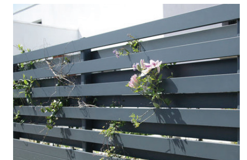
palissade bois peint à lames horizontales en quinconce et plantes grimpantes