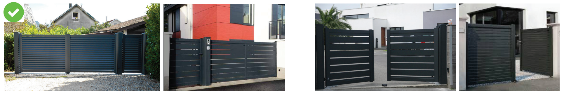
portails 2 battants droits avec ou sans portillon intégré

En cas de portillons intégrés, ils s'harmoniseront avec les portails en termes de traitement (nature du matériau / même sens de lame / hauteur) et de teinte (gris anthracite).