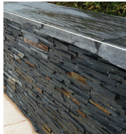
murs en schiste