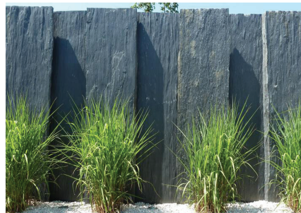
palis de schiste